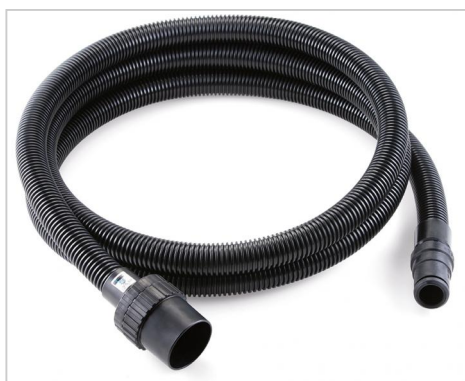
Vnitřní průměr 27 mm, 3,5 m s flexibilní gumovou koncovkou pro připojení k elektrickému nářadí, antistatické. Vhodné pro všechny vysavače VCE