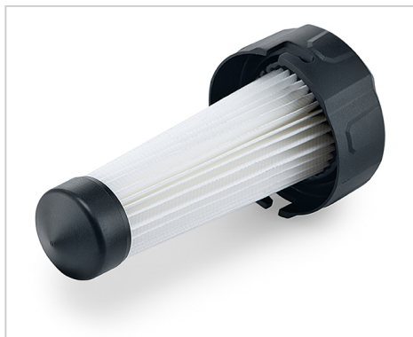
PES-filtr na výměnu pro PES-filtrovou kazetu 486.833.