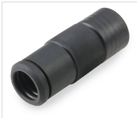
Antistatická objímka Ø 27 mm, s vnitřním závitem, vhodná pro sací hadici 379.395.